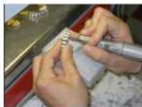
SERVIZI SOCIO - SANITARI ODONTOTECNICO

...UN LAVORO COINVOLGENTE, IN COLLABORAZIONE CON LE FIGURE PROFESSIONALI SPECIALISTICHE, FINALIZZATO AL BENESSERE.