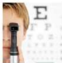
SERVIZI SOCIO - SANITARI OTTICO